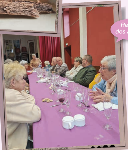
Repas des aînés.