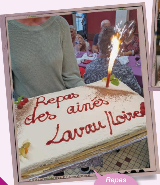
Repas des aînés.