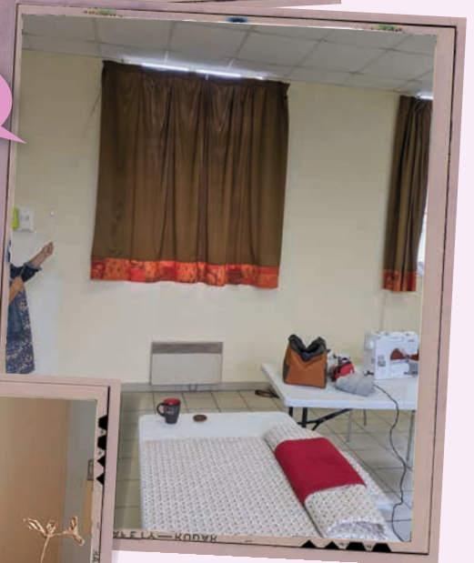
Réfection des doubles rideaux.