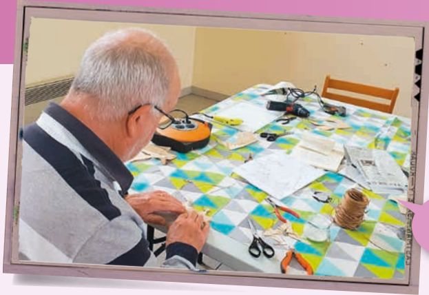
Animation poésie du papier.