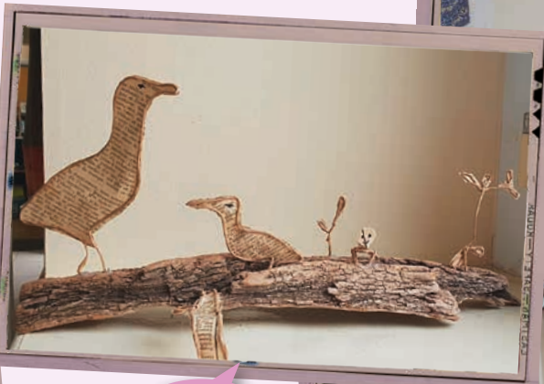
Animation poésie du papier.